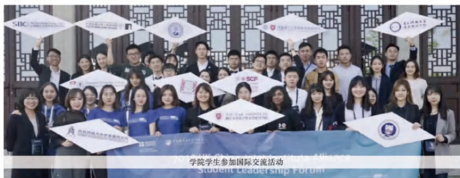
学院学生参加国际交流活动