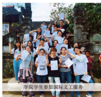
学院学生参加国际义工服务

学院组织学生积极投身社会服务工作，先后有超过3000人次参加了脱贫攻坚评估、养老院服务等志愿服务工作。同时，学生赴法国戛纳青年电影节、英国中亚电影节担任志愿者，赴尼泊尔、印尼巴厘岛、柬埔寨、马尔代夫等地开展国际义工与支教服务，取得了良好的社会声誉。