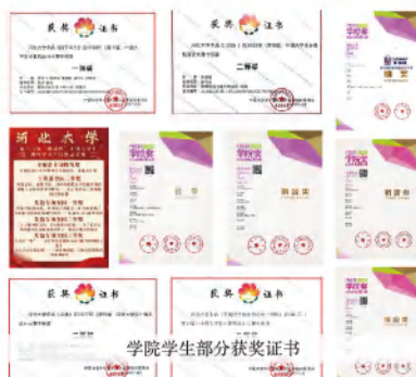
学院学生部分获奖证书

北京本科生担任导演、制片人的纪录片获罗马国际电影节最具历史价值奖、最佳纪录片、最佳纪录片摄影、最佳纪录片导演4项提名，获澳门国际微电影节最佳纪录片奖，入围布鲁诺斯艾利斯国际电影节。