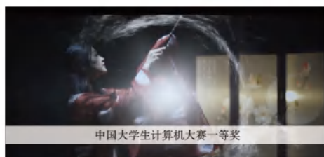
中国大学生计算机大赛一等奖