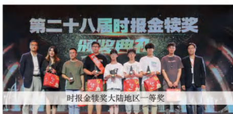
时报金犊奖大陆地区一等奖