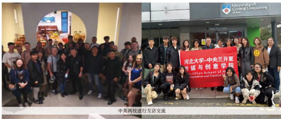
中英两校进行互访交流