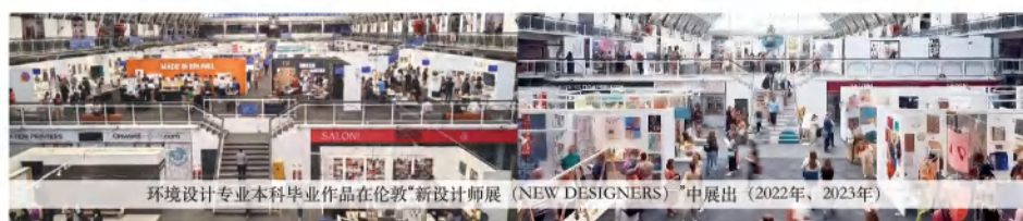
环境设计专业本科毕业作品在伦敦“新设计师展 (NEW DESIGNERS)”中展出 (2022年、2023年)