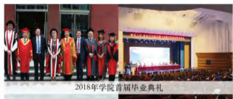
2018年学院首届毕业典礼

学院形成了“项目式教学”、“自助式学生成长模式”、“中英双校园培养机制”的办学特色。学院学生在国际、国内重要学科竞赛及创新创业大赛中屡获佳绩，包括：D&AD英国全球创意奖（“黄铅笔”奖）、全国大学生广告艺术大赛一等奖、“时报金犛奖”一等奖、“挑战杯”全国大学生学术科技竞赛全国一等奖、中国大学生计算机设计大赛全国一等奖、两届“互联网+”大学生创新创业大赛全国铜奖，澳门国际微电影节“最佳纪录片”银奖，等等。同时，学生作品在美国西雅图儿童电影节、深圳国际电影节、英国伦敦“New Designer”设计展等国际国内展览中展出。