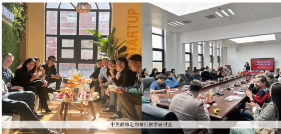
中英教师定期进行教学研讨会