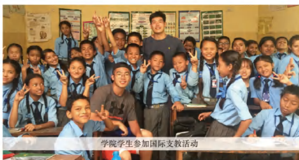
学院学生参加国际支教活动