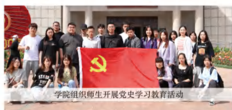
学院组织师生开展党史学习教育活动

在学校党委的坚强领导下，学院大力加强党建工作，落实立德树人根本任务。把党建工作写入学院《合作办学章程》，党建工作的深入开展为学院发展提供了强大的政治保证、思想保证和组织保障。学院党支部成立于2014年，截止2024年4月已有909名师生提交了入党申请书，413人发展为入党积极分子，138人发展成为中国共产党党员。