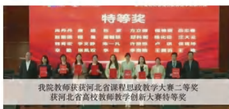
我院教师获河北省课程思政教学大赛二等奖 获河北省高校教师教学创新大赛特等奖