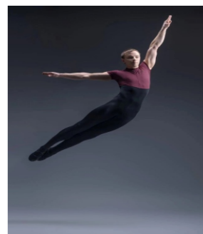
芭蕾舞基础训练 外籍教师