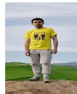
专业英语 外籍教师