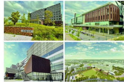
立命馆大学·大阪校区